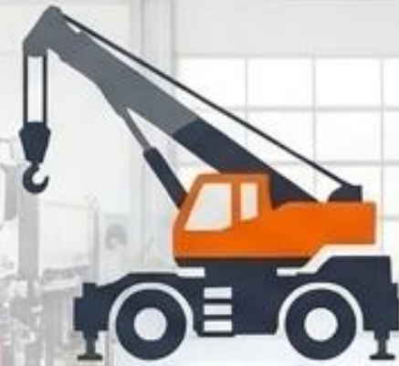
クレーン・特殊車両

社会インフラを支える巨大な車両たち。 扱うスケールが大きいため、整備士自身の 完璧なコンディション管理が求められます。